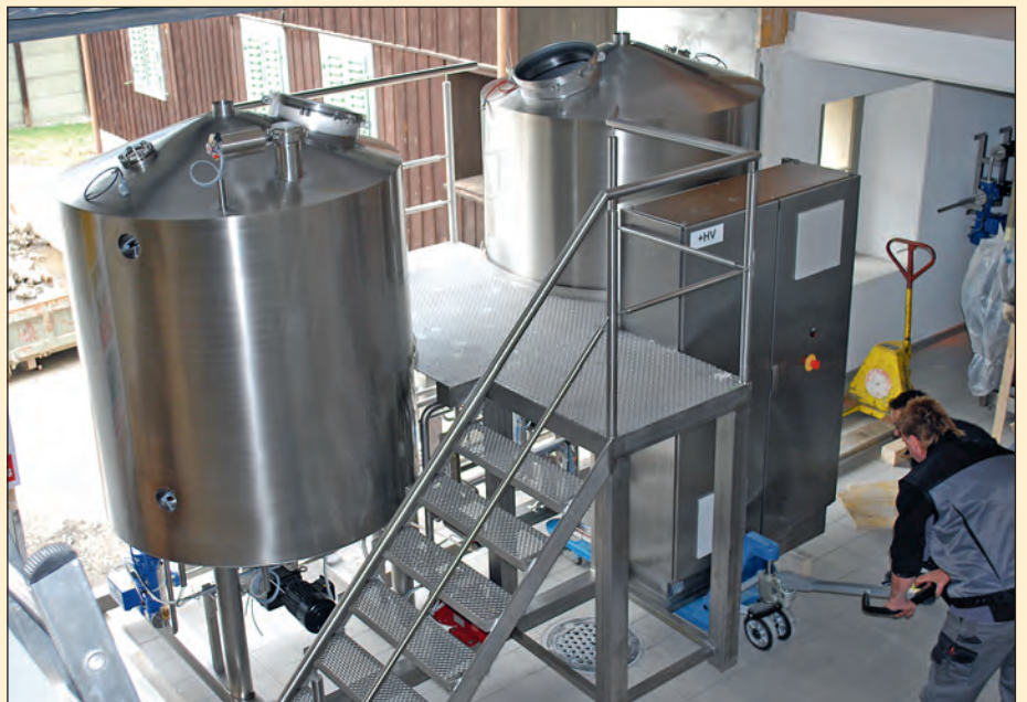
Die Brauanlage findet ihren Platz.

und zwar richtig! Der Samstag, 13. Juni ist unser Feiertag. Das Jubiläum startet mit einem Frühschoppen und Weisswürsten in Begleitung der Schattendorfer Nachtbüäbä, welche übrigens auch zu feiern haben, runde 50 Jahre. Ausgeschenkt wird das Festbier, vom Braumeister speziell für diesen Anlass