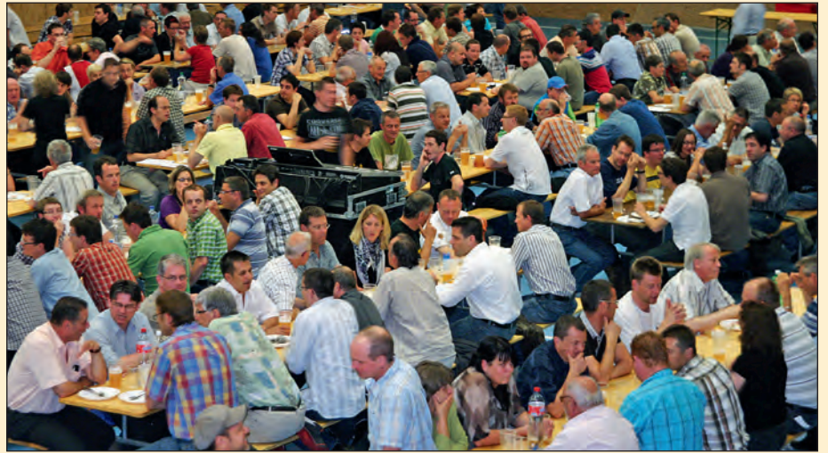
Die erste Generalversammlung der Kleinbrauerei Stjär Biär AG.

schliessen, der Marktstand, Schminken für gross und klein, und, und, und... Am Abend wird gerockt und gerollt, auf der Bühne begrüssen wir The Slapbacks, die Rockabilly Band aus Wien. Vor dem Zelt laden Tische zu einem Schwatz ein und im Stjär-Biär-Wagen packen unsere Barlady's und Barkeeper aus dem Buena Vista ihre Mixbecher aus. Zu später Stunde legt auch DJ Lechti seine Schminkpinsel zur Seite und packt den Musikkoffer hervor. Feiern Sie mit uns, besuchen Sie uns im Brauhaus und geniessen Sie ein tolles Fest!