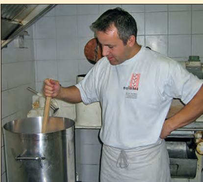
Die ersten Brauversuche.